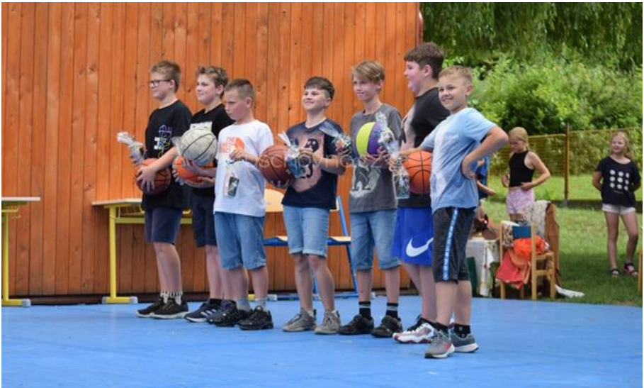
Tým ZŠ Horní Ředice

Na jejich životní cestě jim přejeme mnoho pevných kroků, štěstí a správných rozhodnutí. ☺